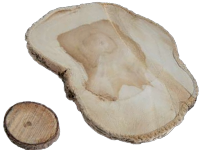
Bilden visar skillnaden mellan en gran och ett teakträd som är lika gamla, 5 år.

Bolagets bedömning är dock att priserna kommer uppnå nivåer kring 1.000 USD om 20 år till följd av det minskade utbudet och den ständigt ökande efterfrågan. Bolaget förväntar sig en stabil värdetillväxt på såväl fastighet som från teakträden, i takt med att dessa växer.